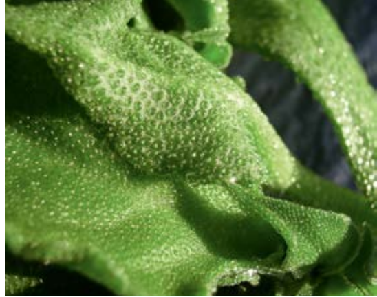
Detail eines Blattes