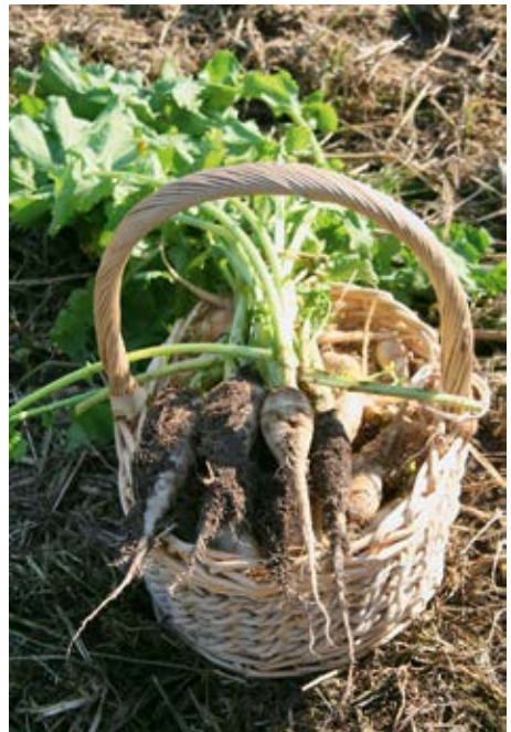
Geerntete Teltower Rübchen

Die Ernte erfolgt im Oktober bis November. Bei einer Lagerung im Keller in leicht feuchtem Sand oder in Erdmieten bleiben die Rübchen einige Monate haltbar.