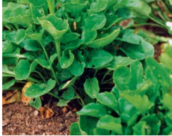
Junge Blätter von Löffelkraut