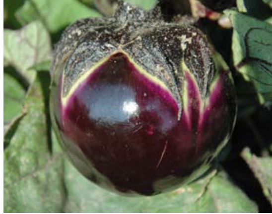
'Ronde de Valence'