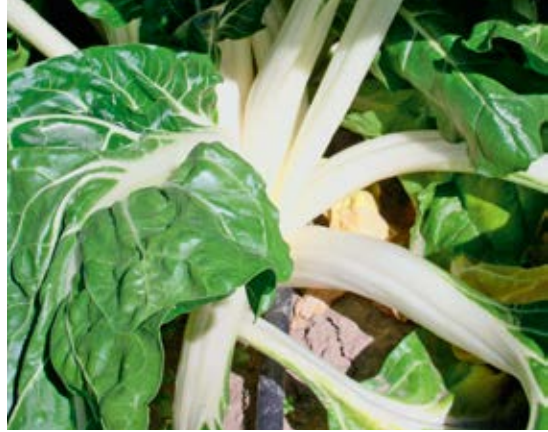
'White Silver 2'