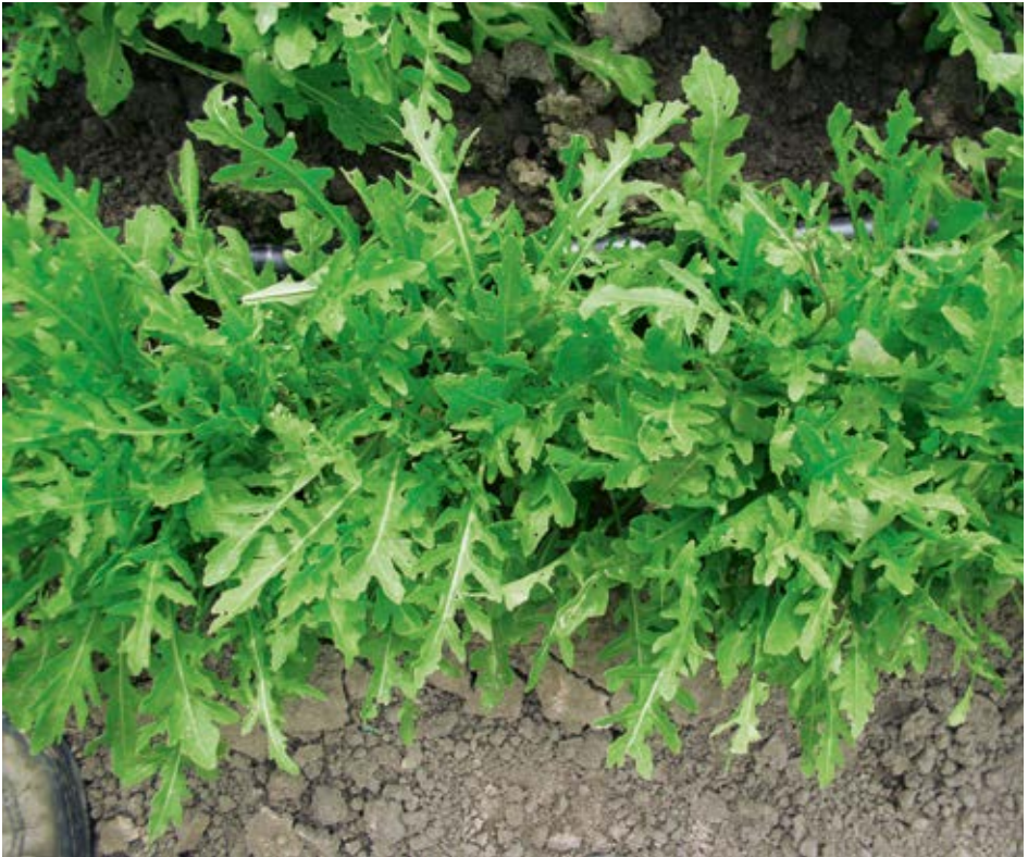
Wilddrauke in Reihe

wie bei der Kulturrauke beschrieben. Das außerordentlich feine Saatgut verlangt ein gut vorbereitetes, feinkrümeliges Saatbett. Die Pflanze bildet eine dem Löwenzahn ähnliche Rosette.