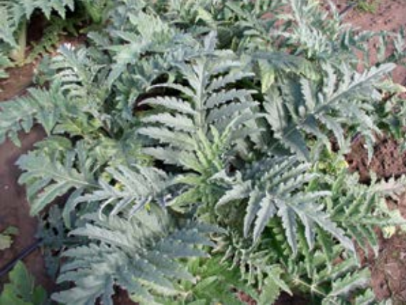
Gefiederte Blätter mit silbergrauem Laub