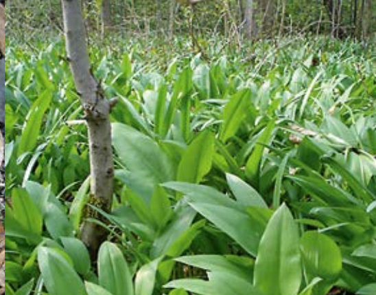
Bärlauchbestand im Frühjahr