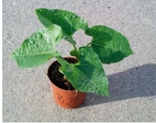
Jungpflanze aus Vorkultur