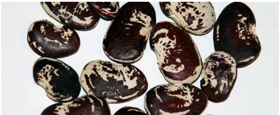
Samen der Limabohne

Die Ernte junger Hülsen beginnt je nach Witterung Ende Juli/Anfang August. Weil die Pflanze ständig neue Hülsen ausbildet, erstreckt sich die Ernte über mehrere Wochen.