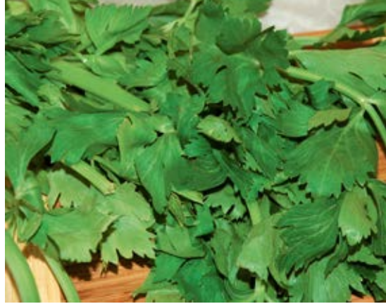
Laub von Staudensellerie