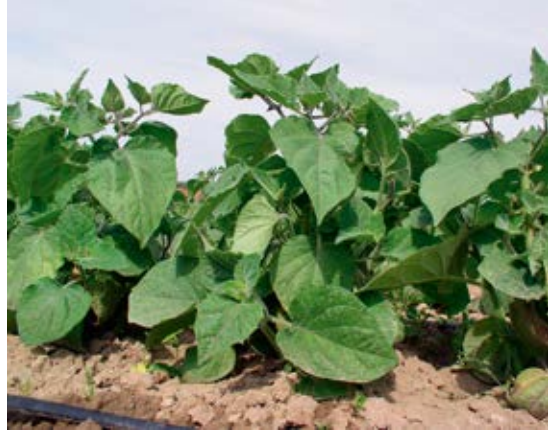
Pflanzen Mitte Juli