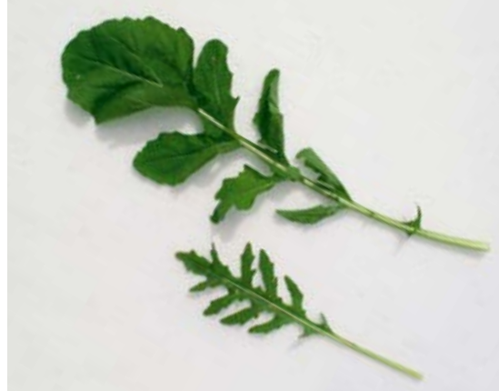
Gewöhnliche Rauke (oben) und Wildrauke